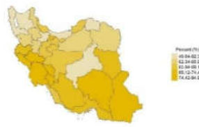
مردان ۱۵ تا ۲۴ ساله بدون شغل