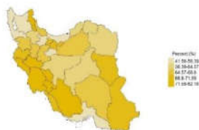
مردان ۱۵ تا ۲۴ ساله بدون درآمد