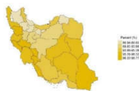
زنان ۱۵ تا ۲۴ ساله بدون شغل