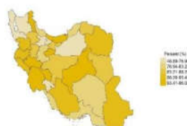
زنان ۱۵ تا ۲۴ ساله بدون درآمد